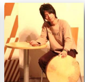
バウロン：アイルランドの片面太鼓